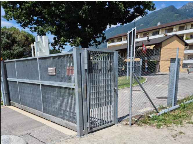
Türe Richtung Locarno